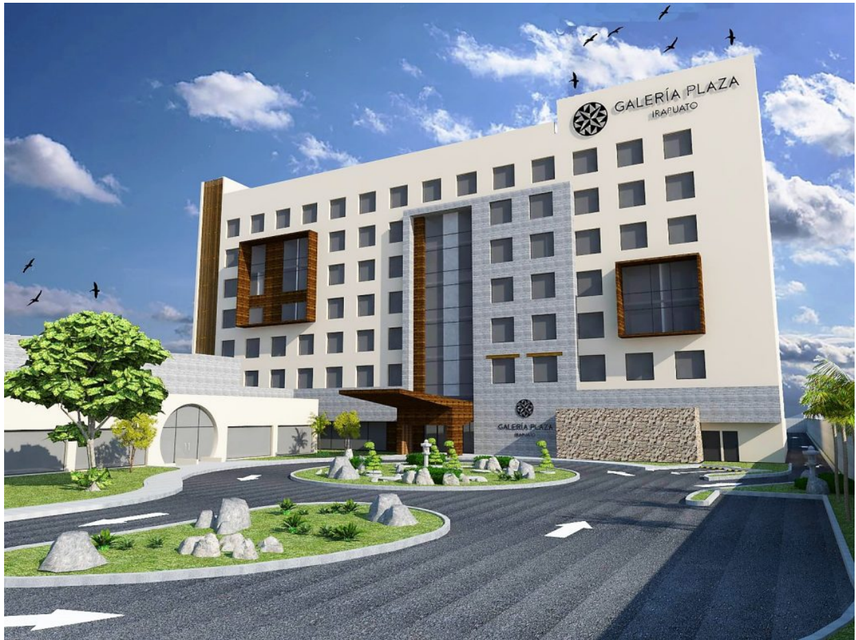
Galería Plaza Irapuato, se inaugurará próximamente y estará cambiando el concepto de hotelería en la región.

Ésta, es la tercera propiedad enfocada al turismo de negocios de Grupo Brisas, con una inversión de 17 millones de dólares y su apertura será en el último trimestre de este año.