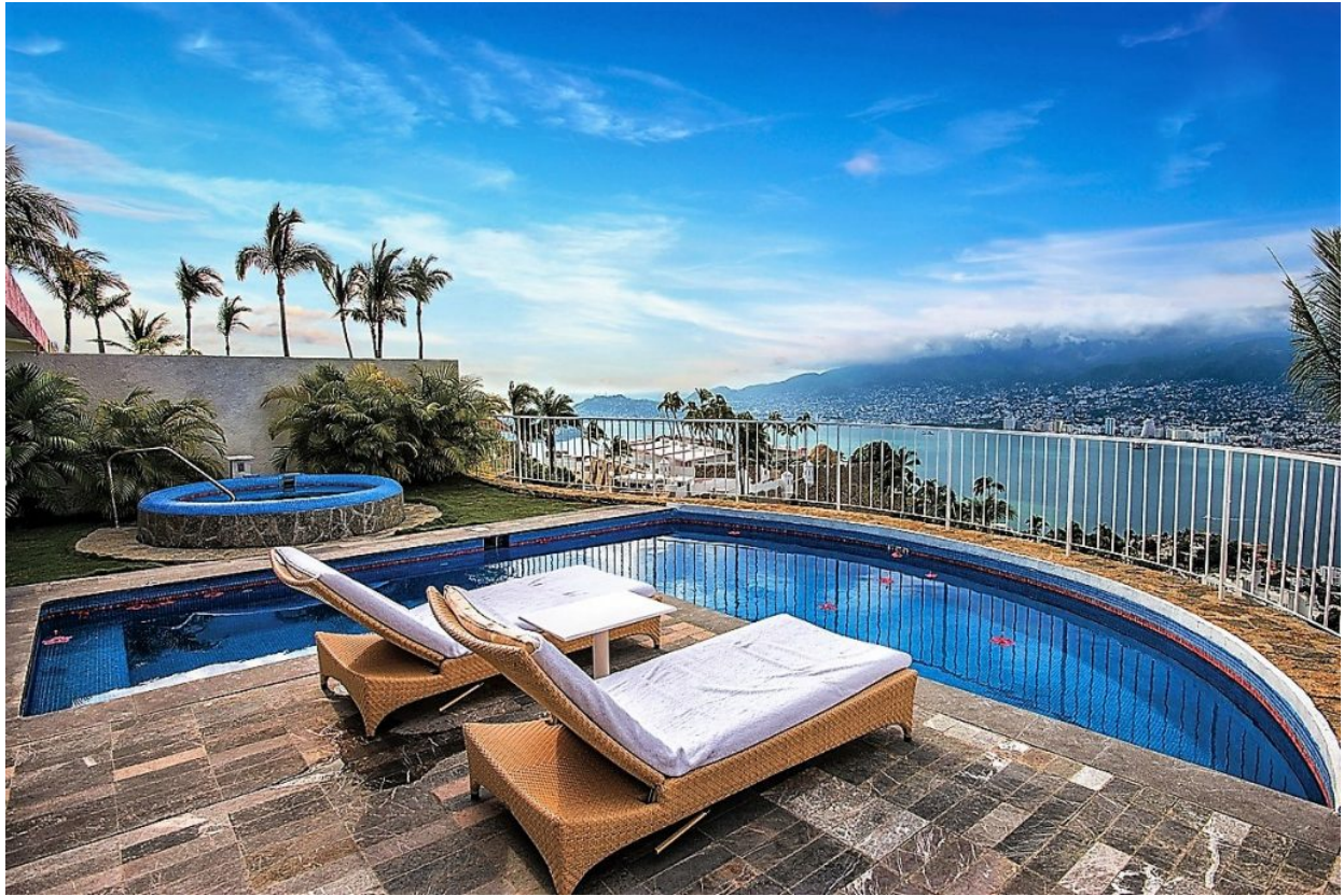
Con una visión enfocada hacia los huéspedes.

Grupo Brisas es una empresa 100% mexicana fundada en 2001 con 3 marcas insignia: Las Brisas, Galería Plaza y NIZUC Resort & Spa.